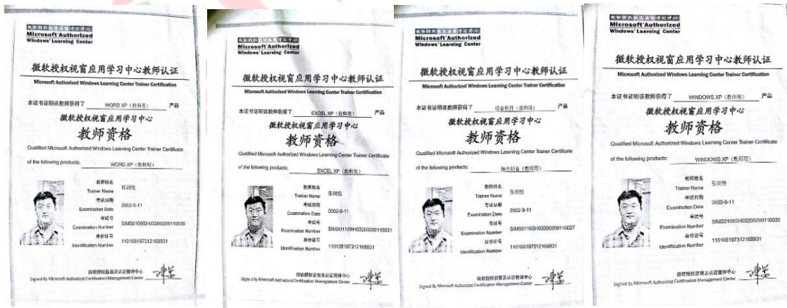
Office 各学科 微软教师资格证书