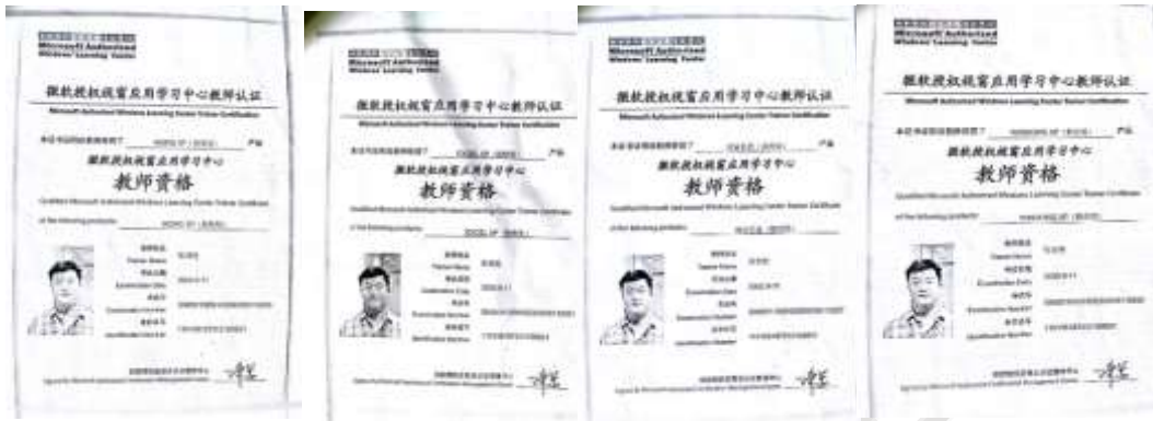
Office 各学科 微软教师资格证书